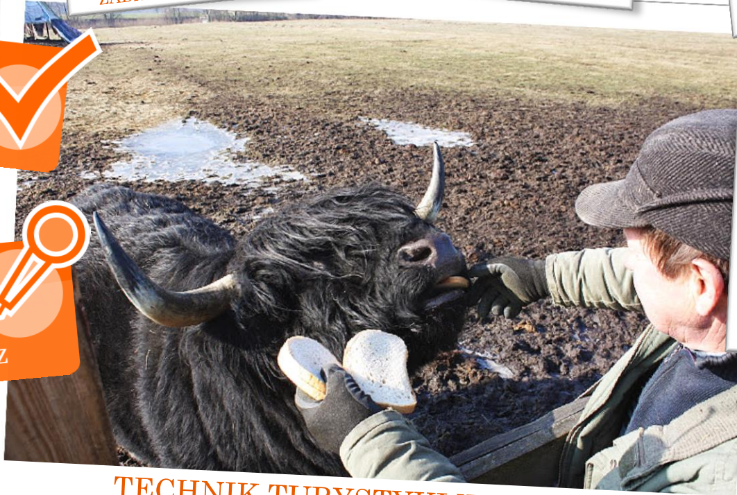
TECHNIK TURYSTYKI WIEJSKIEJ