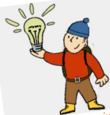
CZY WIESZ, ŻE ...?