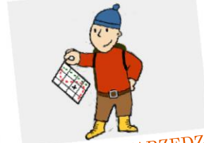
MASZYNY I NARZĘDZIA